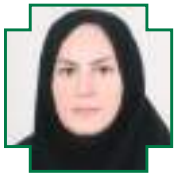
مترجم: لیلا ندرلو

دکتری جامعه‌شناسی اقتصادی و توسعه، اداره کل امور مالیاتی استان زنجان