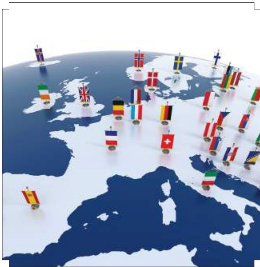
Personal Income Taxation Rates in Europe